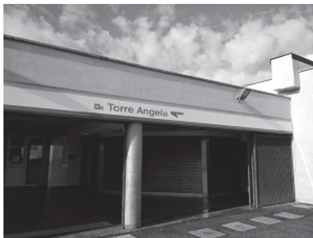
STAZIONE METRO C – TORRE ANGELA Cod. C16